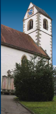
Spomenik je zasnoval arhitekt Vinko Glanz, plaketu v bronu pa je izdelal Vlado Štoviček. Ves spomenik je iz kraškega kamna.